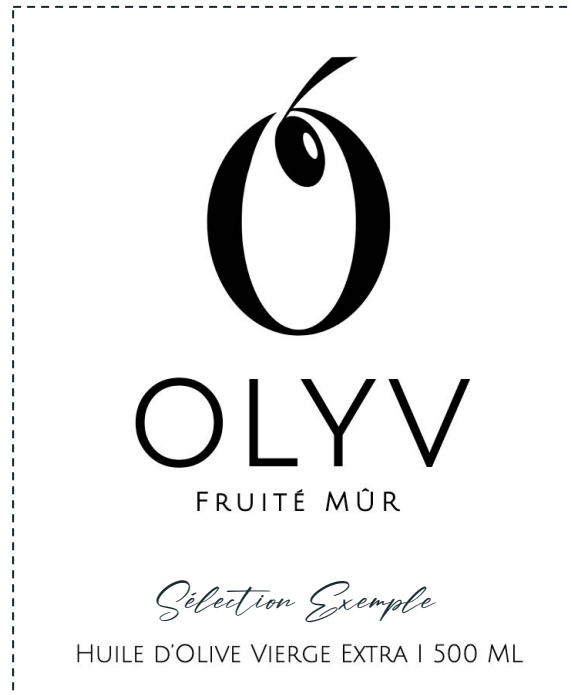
NOM AU CHOIX SUR ÉTIQUETTE