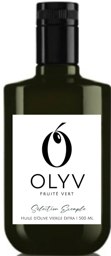
CENTURY DOP 500 ML