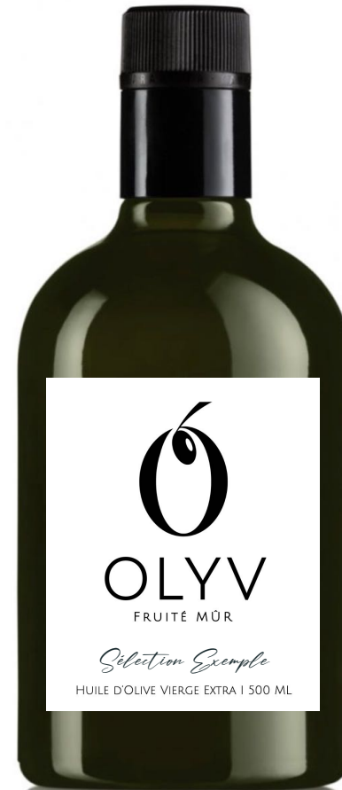
ICE DOP 500 ML (disponible à partir du 01.12.2024)