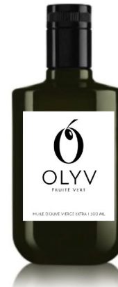
SELECTION FRUITÉ VERT 500 ML CHF 24.90

FRAIS DE PORT POUR 1 BOUTEILLE FRAIS DE PORT POUR 2-5 BOUTEILLES FRAIS DE PORT POUR 6 BOUTEILLES ET PLUS